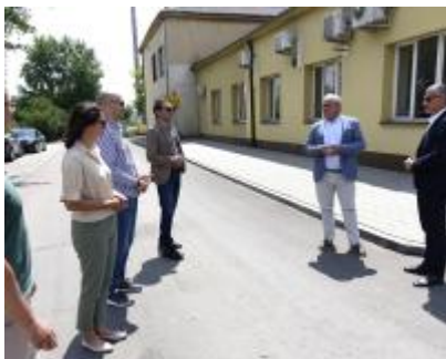
Przebudowa drogi gminnej dojazdowej do dworca PKP w Drzewicy