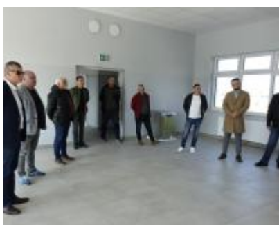
Budowa budynków o funkcji sportowej, kulturalnej i turystycznej na terenie Gminy Drzewica