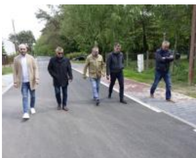
Przebudowa drogi gminnej na ulicy Słowackiego