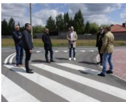
Przebudowa ulicy Żeromskiego